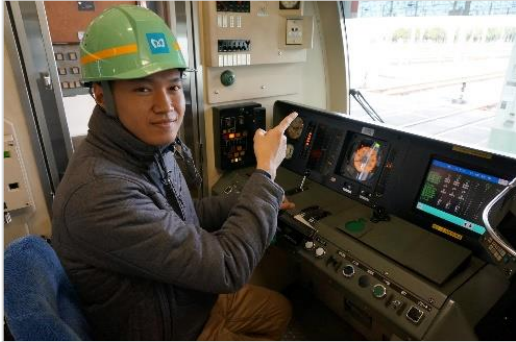
きぎょう げんば たず ふいーるど 企業 の現場を訪ねるフィールド