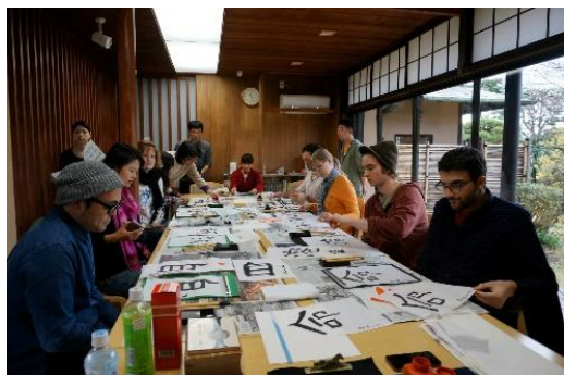
しょうどうか まね かいさい しょうきょうしつ 書道家を招いて開催した書道教室

こんご どりょく くふう つ かさ しょぞん きるよう、今後も努力と工夫を積み重ねていく所存です。