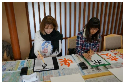
な ふで かんじ ちょうせん 慣れない筆で漢字に挑戦しています。