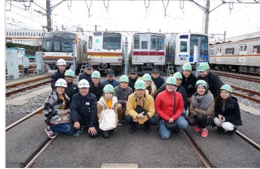
とうきょうめとろ しゃりょうきち 東京メトロの車両基地を